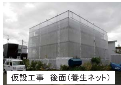
仮設工事 後面(養生ネット)

施工前の状況: 屋根部は経年による発錆、ハゼ部コーキングの劣化。 金属サイディング部も経年劣化による白亜化、発錆が見受けられたため、早急の 塗装改修が必要となりました。