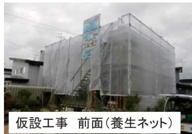
仮設工事 前面(養生ネット)