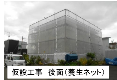
仮設工事 後面(養生ネット)

施工前の状況:屋根部は経年による発錆、ハゼ部コーキングの劣化。 金属サイディング部も経年劣化による白亜化、発錆が見受けられたため、早急の 塗装改修が必要となりました。