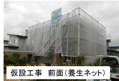
仮設工事 前面(養生ネット)